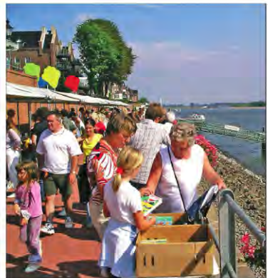
• Livemusik, Leckereien vom Grill, eine Fahrradbörse - das Programm beim Reeser Stadtfest ist vielfältig.