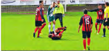
• Es gab zahlreiche Fouls in der Partie...