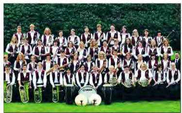
• Bietet ein spektakuläres Musikevents zum 50-jährigen Bestehen: das Jugendblasorchester Isselburg.