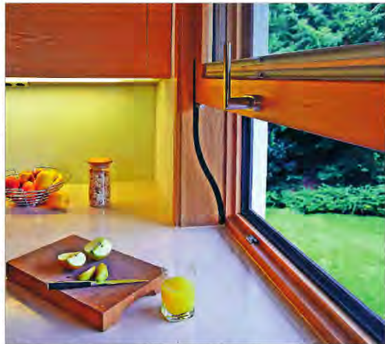
• Ein Fenster, das sich nach oben öffnet, verbindet Küche und Terrasse.

und in kleinen Zimmern wird nicht so viel Platz vom offenen Fenster in Anspruch genommen. Fensterbänke, auf denen Pflanzen stehen, müssen nicht mehr extra für das Lüften freigeräumt werden. Da sich die Scheibe nach oben öffnet, bleibt alles an seinem Platz.