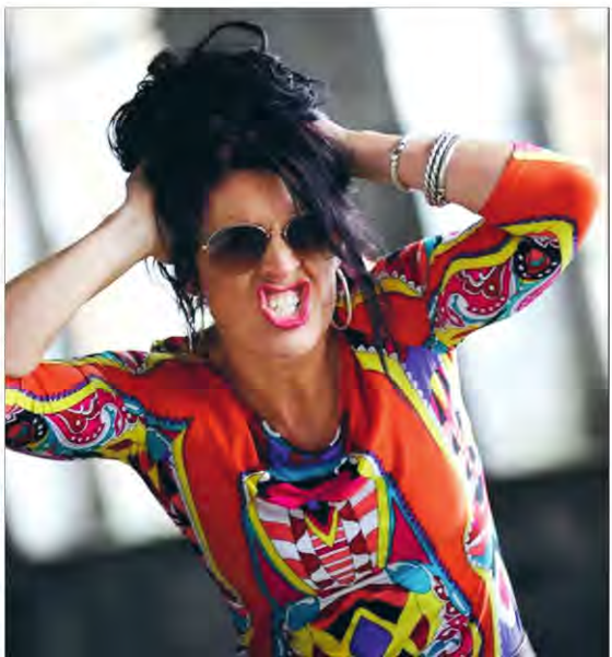
Let's go crazy... by Norbert Paus

cholt ein. Dort stellen sich Kandidaten im direkten Gespräch den Fragen der Bürgerinnen und Bürger. Die nächsten zwei Termine: 15. und 20. Mai, 18 Uhr. Das Bürgerforum findet in den Räumlichkeiten des Medienzentrums Boholt statt.