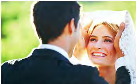
• Spitze liegt als Material im Trend und passt zum „Vintage“-Motto.