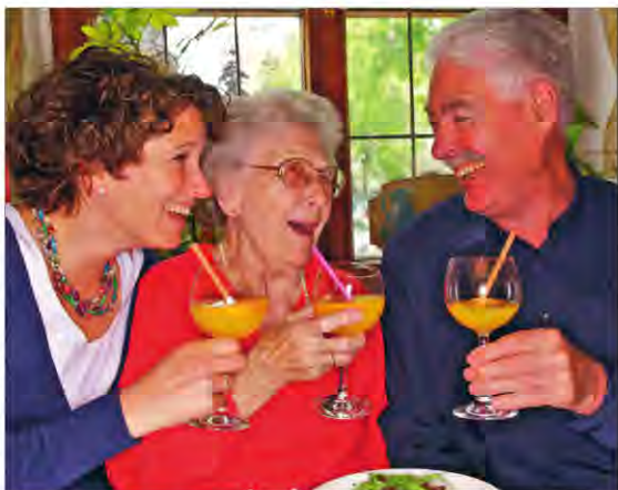
• Familienfeste wollen gut vorbereitet sein, damit sie auch gelingen.

recht günstig, haben aber den Nachteil, dass sie nicht so besonders edel und festlich wirken. Stoffservietten, die anspruchsvoll gefaltet und gut gestärkt sind, können eine anspruchsvolle Tischdekoration noch vervollständigen. In Sachen Einladungskarte ist die Druckerei vor Ort Ansprechpartner, der Gastronomiebetrieb, in dem die Feierlichkeit stattfinden soll, berät gerne zur Ausrichtung der Tische und stellt sich individuell auf den Kunden ein. Wer Unterstützung und Hilfe benötigt, der darf sich gut beraten wissen. Vom Buffet bis zum Menue - alles ist möglich. Und auch preislich lässt sich das Catering individuell anpassen. Wer die komplette Organisation einer Veranstaltung abgeben möchte, kann dies tun. Veranstaltungsagenturen übernehmen die komplette Ausarbeitung, Organisation und Planung.