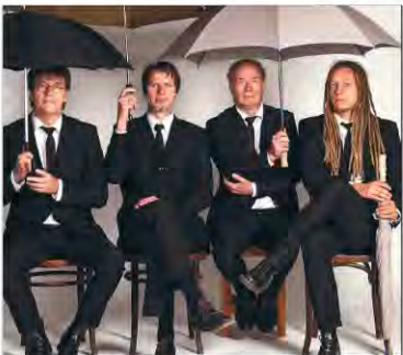
• Rubber Soul sind wieder in Suderwick zu erleben.

Ihr Boholter Report ist auch vertreten auf Facebook/boholterreport