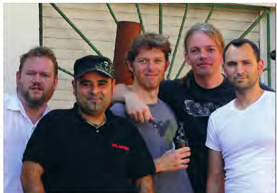
• Zuerst gucken alle das Pokalfinale, dann tritt die Band „Kopfschuss“ auf.

Weiter geht es dann am Samstag, 17. Mai. An diesem Tag ist