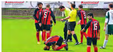
• ...und insgesamt drei Platzverweise.