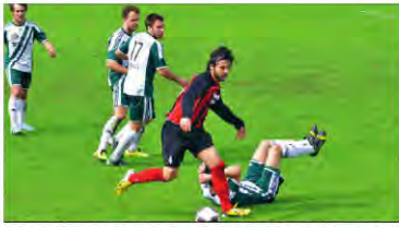
• Der SC 26 machte einen riesen Schritt in Richtung Klassenerhalt.